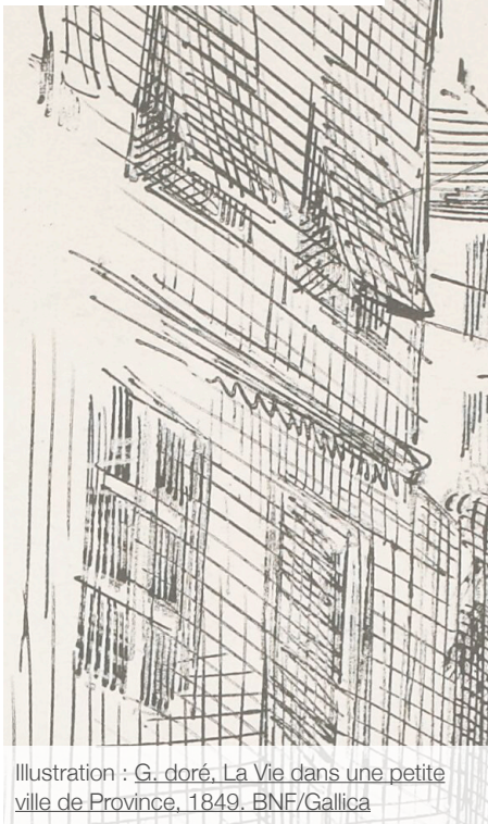
Illustration : G. doré, La Vie dans une petite ville de Province, 1849.